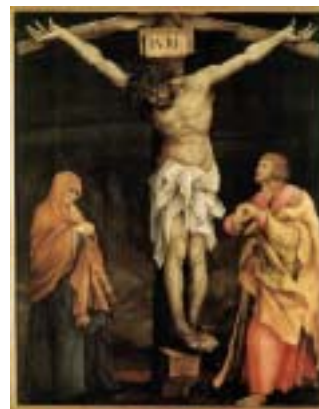
Illustration: FOLKEKIRKEN i København

Afhensyn til indkøb vil vi dog gerne bede om tilmelding. Tilmelding skal ske til kordegenen senest fredag den 6. april.