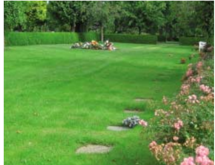
Kistegrav i græsplæne

med bogstaverne hugget ned i stenen, således at græsslåmaskinen kan køre hen over hele området. De efterladte betaler, samtidig med gravstedskøbet, pasning af gravstedet i fredningsperioden, der normalt er på 20 år. Herved opnås at de efterladte ingen yderligere forpligtelser har, men kan besøge gravstedet og tænke de tanker, der for dem er de rette.