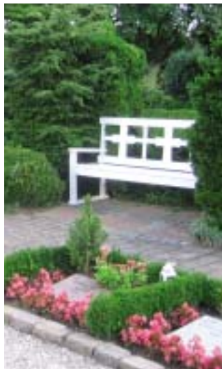
Urnegravsted med blomster

Et urnegravsted med blomster er på Grøndalslund kirkegård et gravsted hvor de efterladte samtidig med gravstedskøbet betaler for pasningen i fredningsperioden der normalt er på 10 år. Pasningen består blandt andet af årlig plantning af 10 stedmoderplanter, 10 begoniaplantter samt gran-