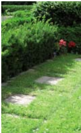
Urnegravsted i græsplæne

Et urnegravsted i græsplæne er som et kistegrav i græsplæne ,